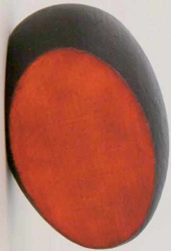
'Rode kern' 2019 / 6 x 3,5 cm / olie op hout