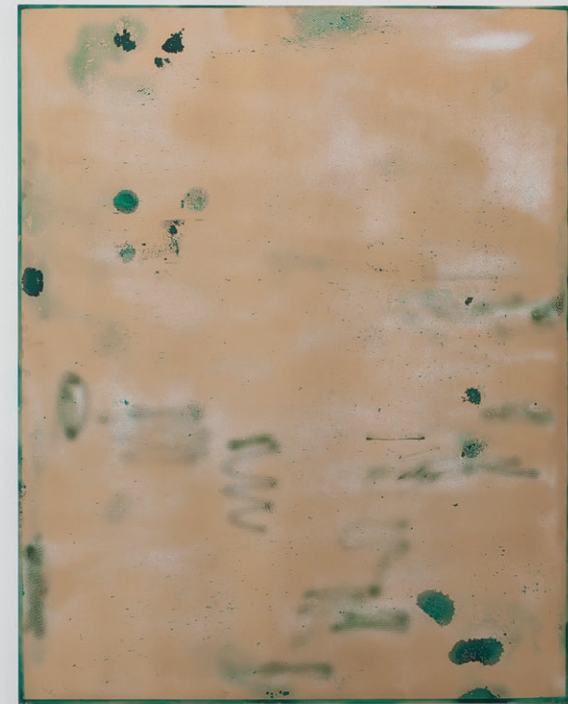
'DUDE - Gold field' 2018 / 150 x 130 cm / acryl op doek