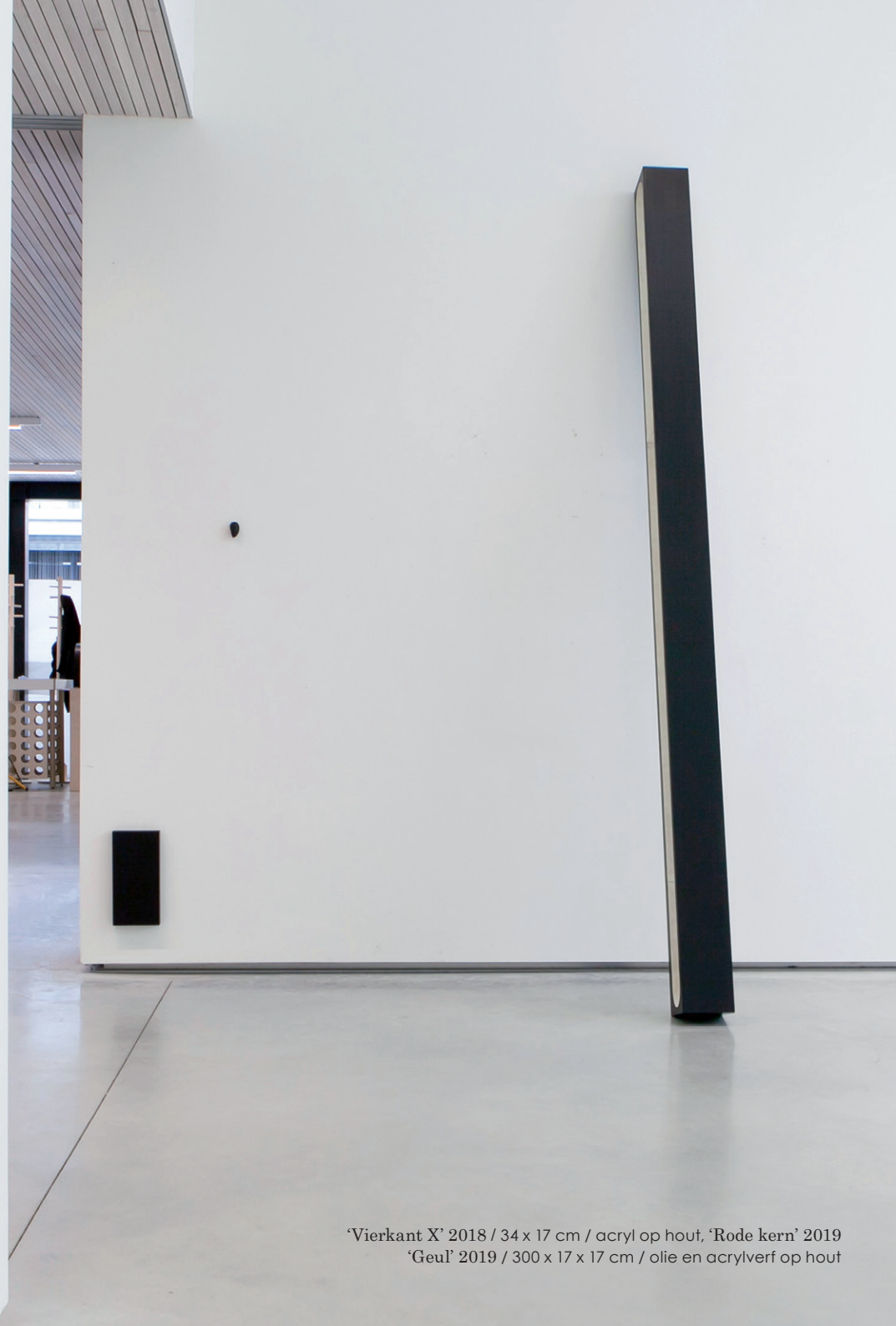
'Vierkant X' 2018 / 34 x 17 cm / acryl op hout, 'Rode kern' 2019 'Geul' 2019 / 300 x 17 x 17 cm / olie en acrylverf op hout