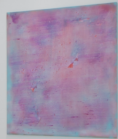
'J.M.T. n°20180420 - Endless' en 'J.P. n°20180430 - Where the wild roses grow' 2018 beiden 145 x 115 cm / acryl op doek