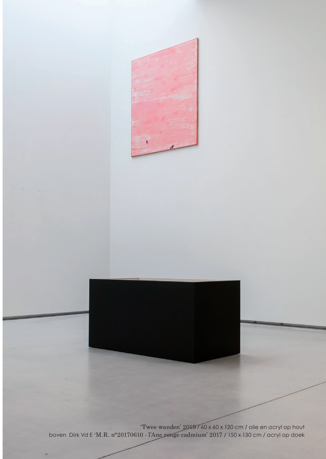
'Twee wanden' 2019 / 60 x 60 x 120 cm / olie en acryl op hout boven Dirk Vd E 'M.R. n°20170610 - l'Ane rouge cadmium' 2017 / 150 x 130 cm / acryl op doek